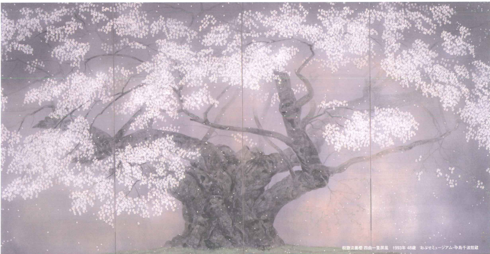
樹豊淡墨楼 四曲一隻屏風 1993年 48歳 おぶせミュージアム・中島千波館蔵

2019.5月10日[金]～7月9日[火] 会期中無休 午前9時～午後5時(7月は午後6時まで)