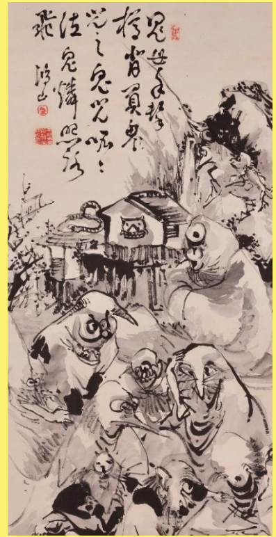
高井鴻山「妖怪山水園」(部分)