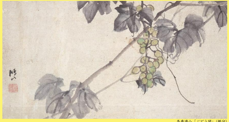
高井鴻山「ぶどう園」(部分)