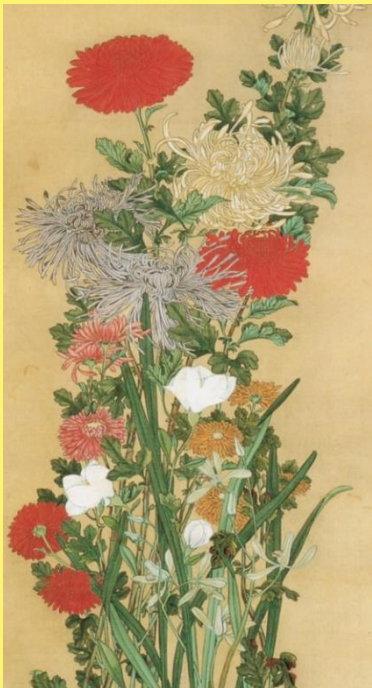
高井鴻山「菊園」(部分)